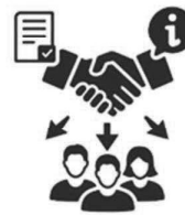
Unterstützung der Begleitmaßnahmen

Das digitale Gerät von Schülerinnen und Schülern wird von den Schulen, die für die Verwaltung (Mobile Device Management) zuständig sind, mit modernen Kinderschutzfunktionen ausgestattet. Diese schützen Schülerinnen und Schüler vor ungeeigneten Internet-Inhalten und App-Installationen.