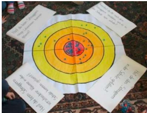
Abbildung 8: Evaluations-Zielscheibe VS Goritschach (Schönherr, 2015)

In Goritschach 26 ist die Volksschule durch einen angebauten Turnsaal direkt mit einem der Kindergärten verbunden, eine Zusammenarbeit der beiden Institutionen gab es bis vor wenigen Jahren jedoch nicht. Informationen über Stärken und Schwächen der Kinder im letzten Kindergartenjahr durften nicht an das Lehrpersonal der Schule weitergegeben werden, wodurch wertvolle Zeit in der Schuleingangsphase verloren ging. Diesem Umstand wollte der Volksschuldirektor entgegenwirken und entwickelte die Idee, die Gruppe der zukünftigen Schulkinder bereits in das Schulgebäude einzugliedern. Nach umfangreichen Umbauarbeiten und großer Zustimmung seitens der Eltern ließen sich im neuen Kindergarten in der Volksschule sogar drei Gruppen bilden. Zwei weitere Kindergärten der Gemeinde bekundeten ebenfalls ihr Interesse an dem Projekt, sodass sich schlussendlich insgesamt fünf Kindergartengruppen wöchentlich abwechselten und an jedem Dienstag in Kleingruppen von maximal zehn Kindern für eine Stunde am Klassenunterricht teilnahmen. Eine mögliche Angst vor der Schule sollte minimiert werden, indem die Kinder sich mit der Infrastruktur, dem Schulgebäude und den Lehrkräften bereits vor Schulbeginn vertraut machen konnten.