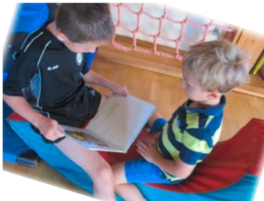
Abbildung 7: Partnerkind mit »Schützling« VS St. Oswald

Zusammenfassung der Vorschulklasse bis zur 2. Schulstufe zu Familienklassen (Mehrstufenklassen) gefördert. Zur Erhaltung und Verbesserung der Schul- und Unterrichtsqualität dienen jährliche Evaluierungen mittels Fragebögen als Grundlage zur Reflexion und Schulentwicklung.