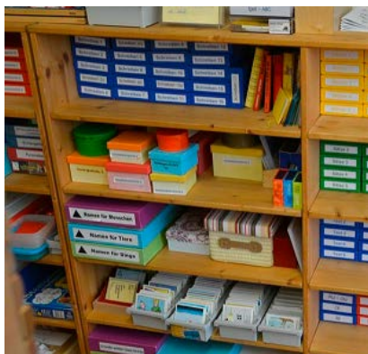
Abbildung 3: Differenzierte Materialien VS Ludesch

Die Unterrichtsmaterialien sind nach Fächern und Schwierigkeitsgraden in verschiedenen Regalen geordnet und jederzeit für die Schülerinnen und Schüler zur selbstständigen Nutzung zugänglich. Zudem befindet sich ein großer runder Teppich im Raum, der zum gemeinsamen Arbeiten und Verweilen einlädt