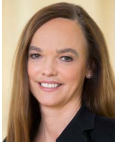
Dr. in Sonja Hammerschmid

Die Weiterentwicklung der Grundschule ist das pädagogische Herzstück der Bildungsreform. Die einzelnen Maßnahmen müssen zusammen mit den Neuerungen im elementarpädagogischen Bereich gesehen werden und haben das Ziel, die Kinder mit ihren verschiedenen Interessen und Potentialen zum Ausgangspunkt für die Planung und Gestaltung von Bildungsprozessen zu machen.