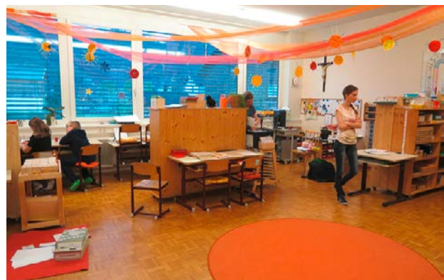
Abbildung 4: Klassenzimmer mit großem, runden Teppich VS Ludesch