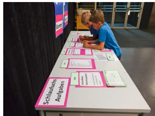
Abbildungen 1 und 2: Schlaufuchstisch der VS Weyer